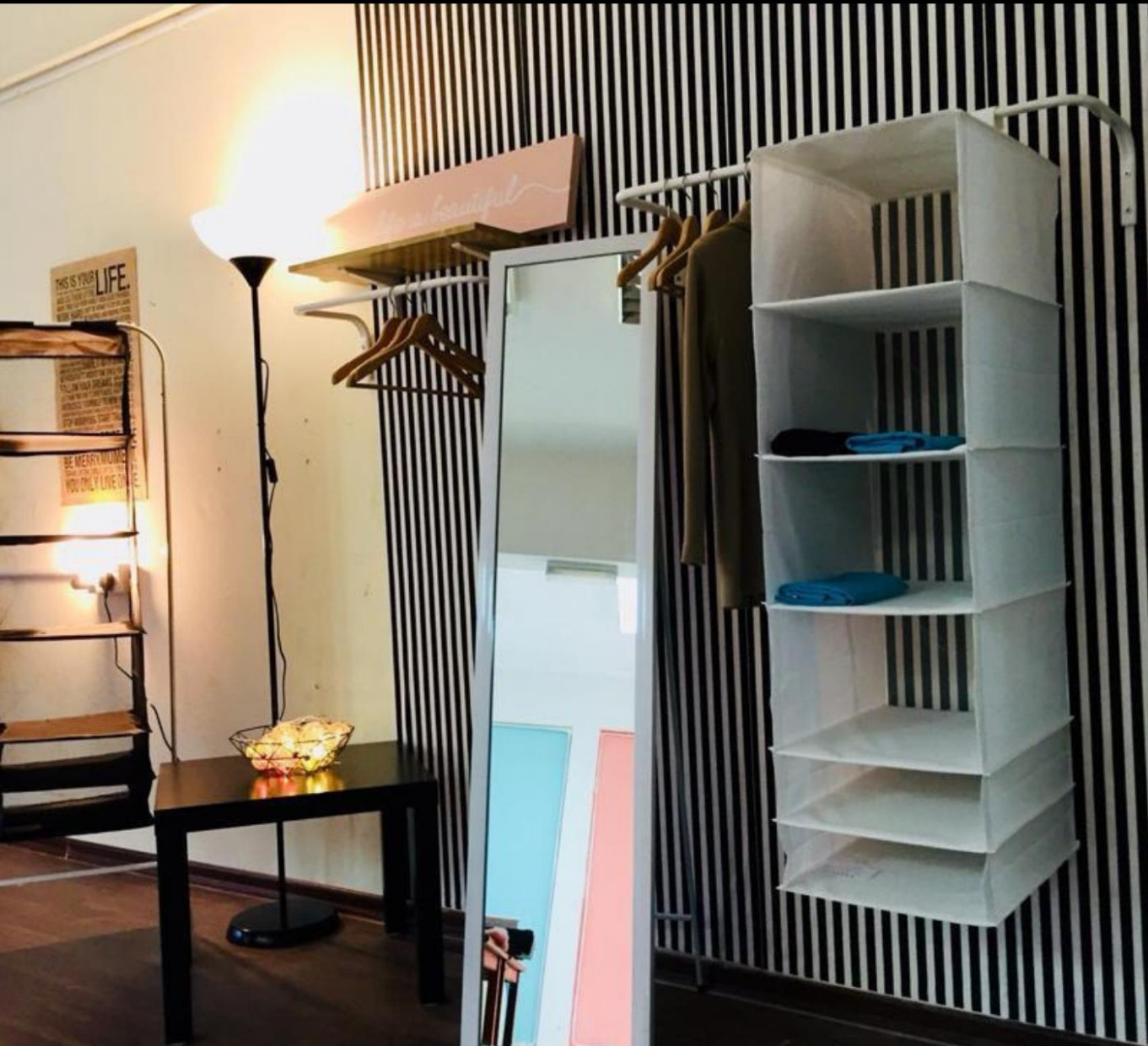
BILIK INKUBATOR KKTM