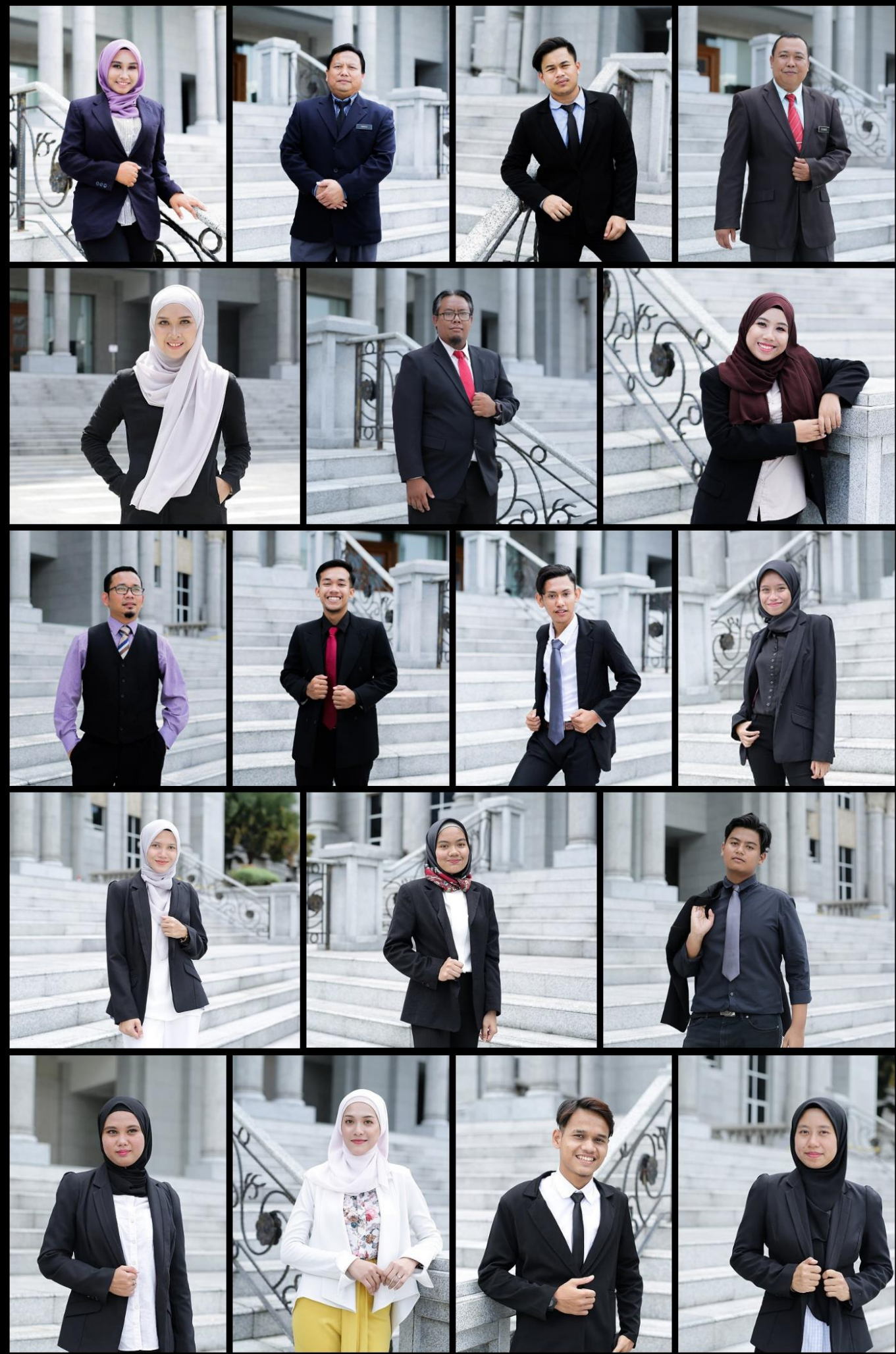
THE POWER OF 'PERSONAL BRANDING 2018'