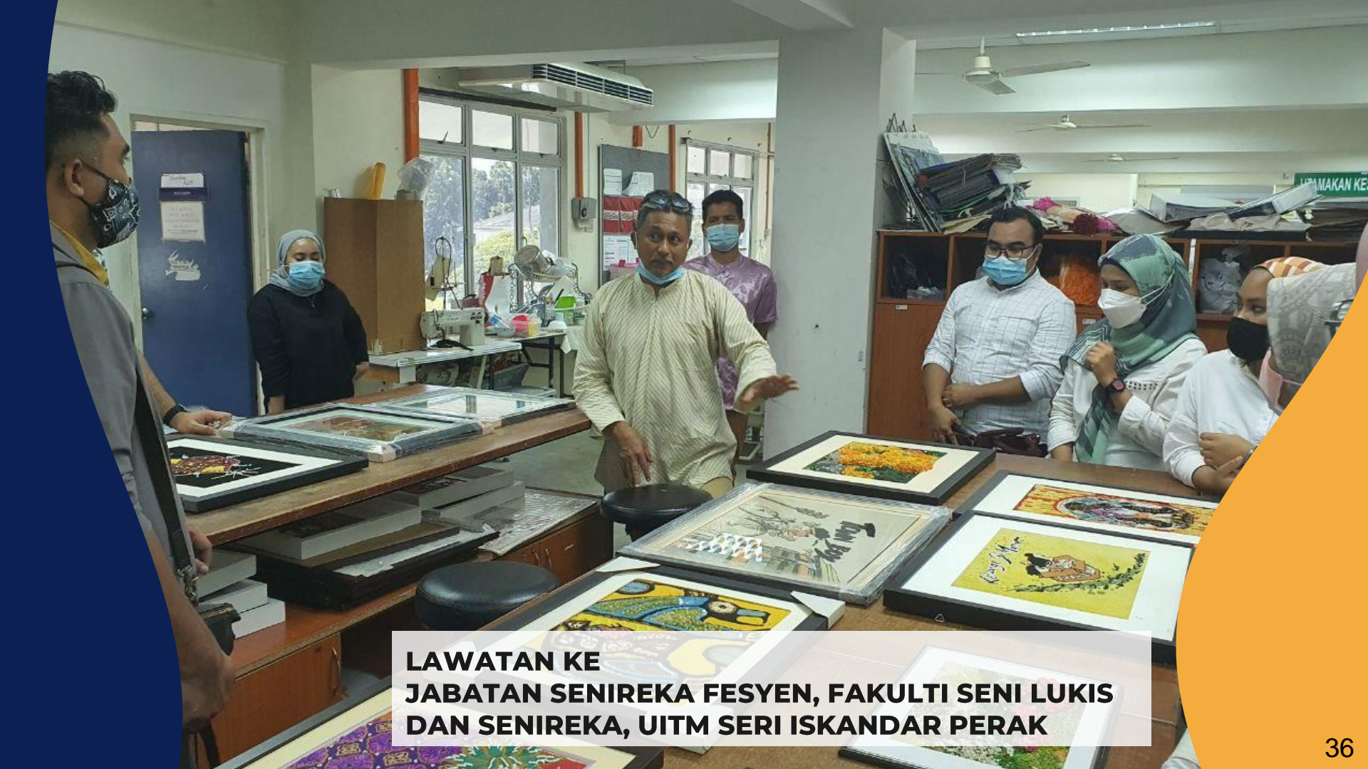
LAWATAN KE JABATAN SENIREKA FESYEN, FAKULTI SENI LUKIS DAN SENIREKA, UITM SERI ISKANDAR PERAK